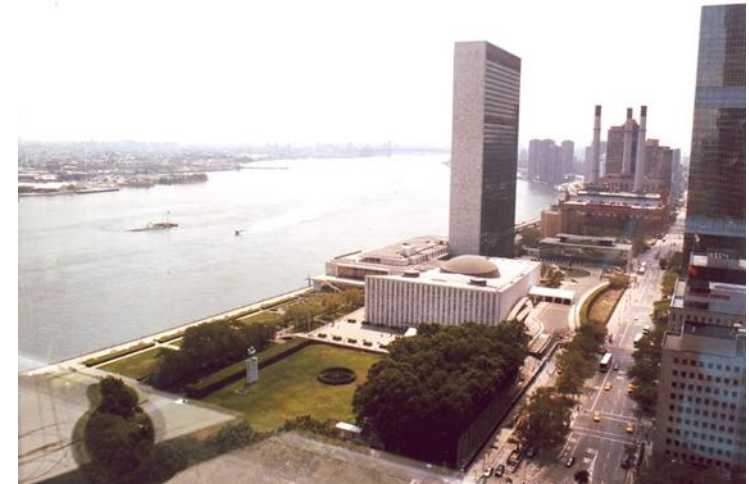
Bild: UN Gebäude in New York