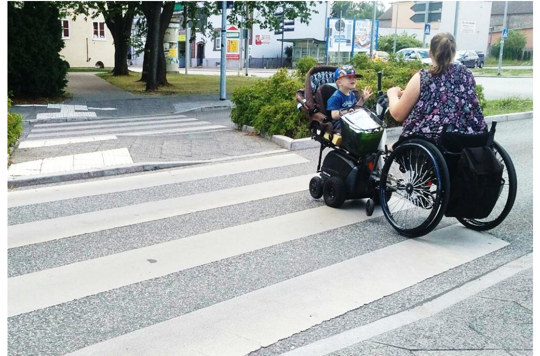
Fußgängerüberweg mit Null-Borden und taktilem Leitsystem mit Bord

Was denken Sie? Gibt es Fragen? Ideen? Ihre Erfahrungen mit der Gestaltung von Barrierefreiheit? Wie gestalten Sie Partizipation bei Ihren Projekten?