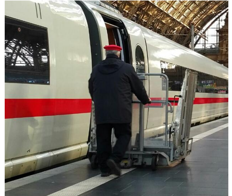
Anlegen eines Hubliftes an Barriere-Zug mit Stufen der DB AG