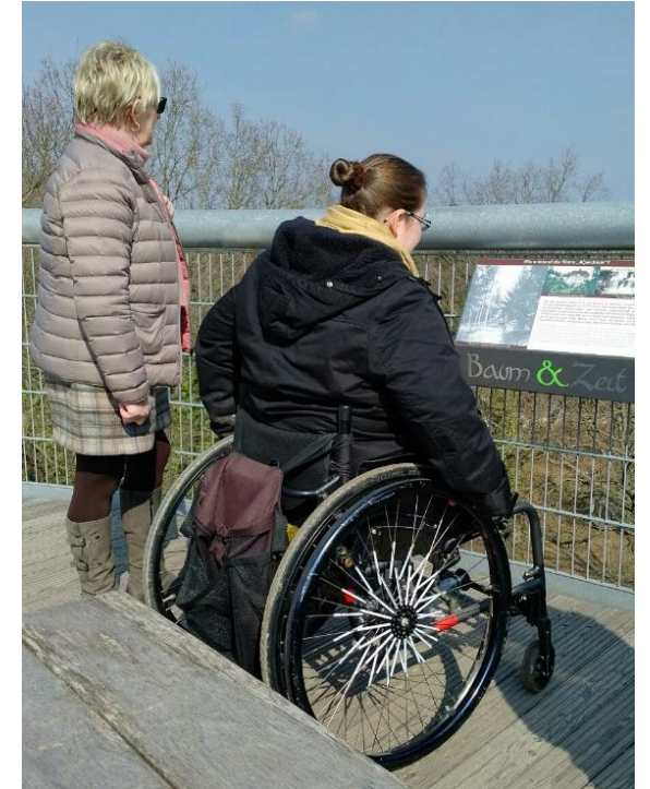
barrierefreier Baumkronenpfad