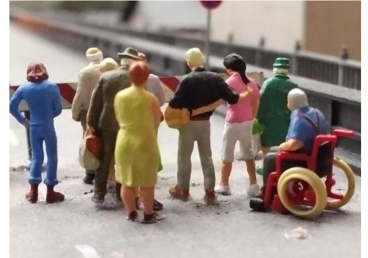
Menschengruppe steht vor einer Absperrung